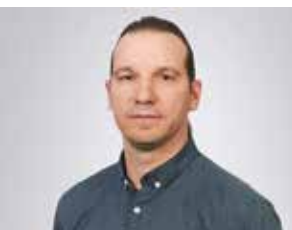
Markus Nehring Aufnahmekoordination